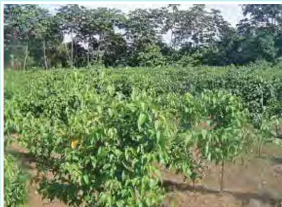
6 de Junio de 2013