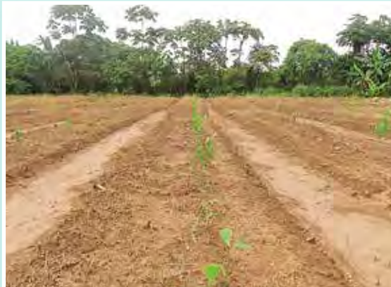
10 de Enero de 2013