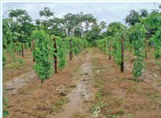
7 de Marzo de 2013