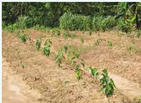
24 de Enero de 2013