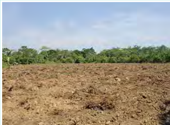
26 de octubre de 2012