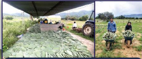
Cosecha de 25.000 pencas de tuna para forraje de los cinco huertos madre