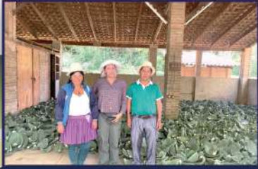
Entrega a municipios del Cono Sur de Tuna para Forraje