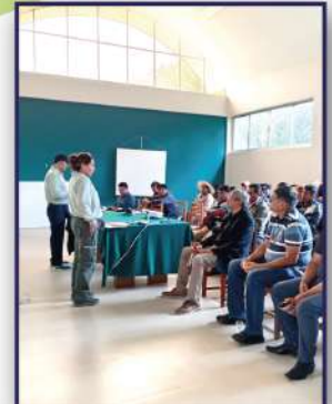
Curso de capacitación dirigido a técnicos y productores agropecuarios