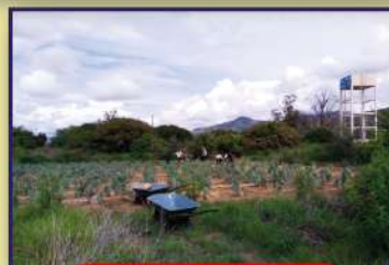
Estación San Benito