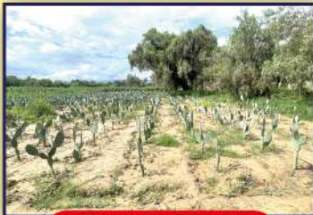
Fundo "La Violeta"