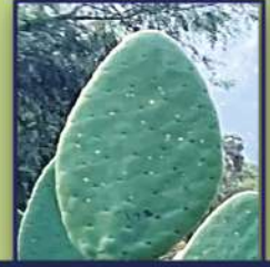
Difundir el cultivo de tuna Accesión 38