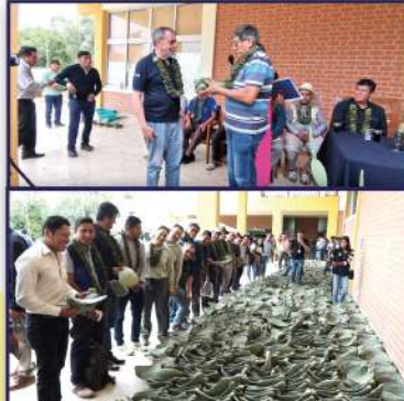
Entrega Oficial de Tuna para forraje por parte de la UMSS a la Gobernación