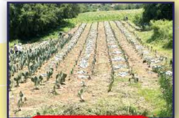
Fundo Chingurí - Aiquile